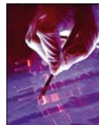
Mit Hilfe der Elektrophorese werden Antikörper (Eiweiße) gemessen. Auch beim HIV-Test wird so verfahren.

Die Patienten werden grundlos in massive Ängste gestürzt.